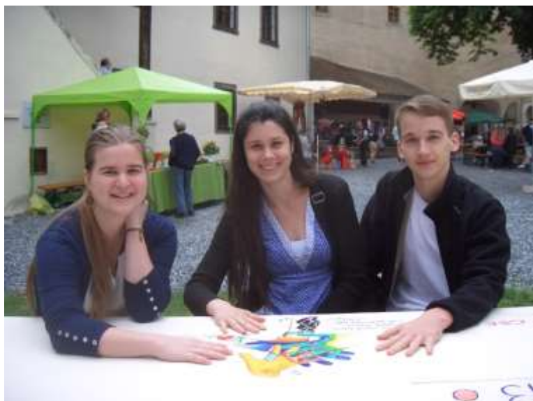
Diese 3 Besucher aus Ungarn malten gemeinsam ein Friedensbild (nachfolgend abgebildet)