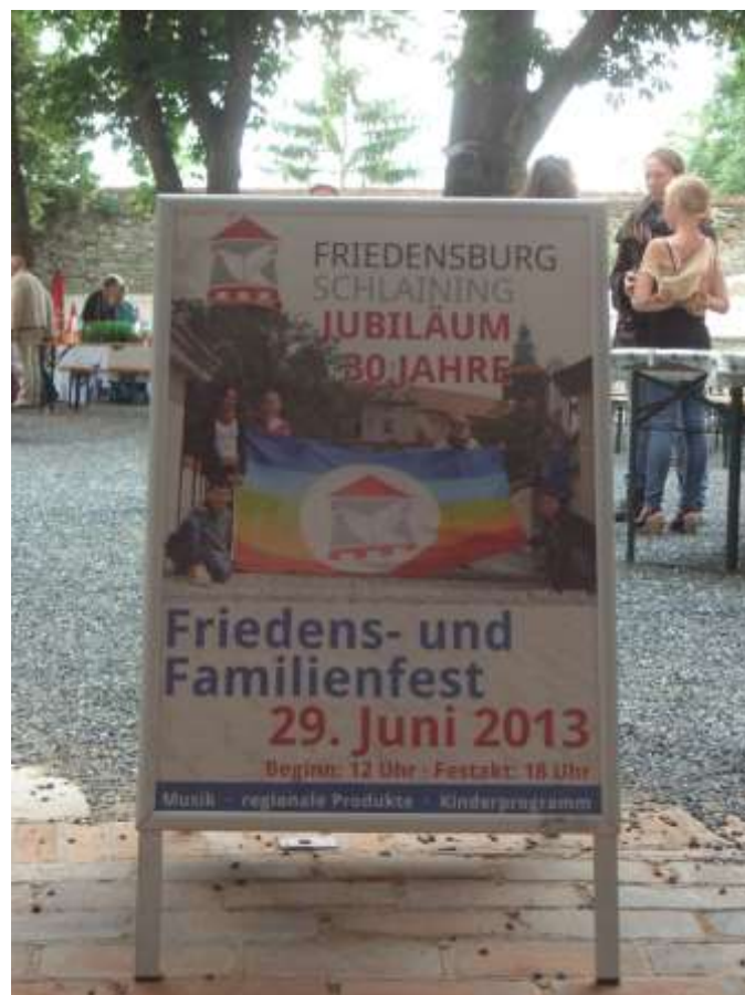
Offizielles Poster des Friedens- und Familienfestes auf der Burg Schlaining

Nachfolgend einige Fotos von der Veranstaltung: